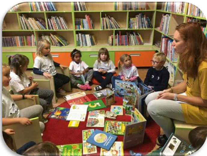
(PŘEDŠKOLÁČCI NA NÁVŠTĚVE ŠKOLNÍ KNIHOVNY)