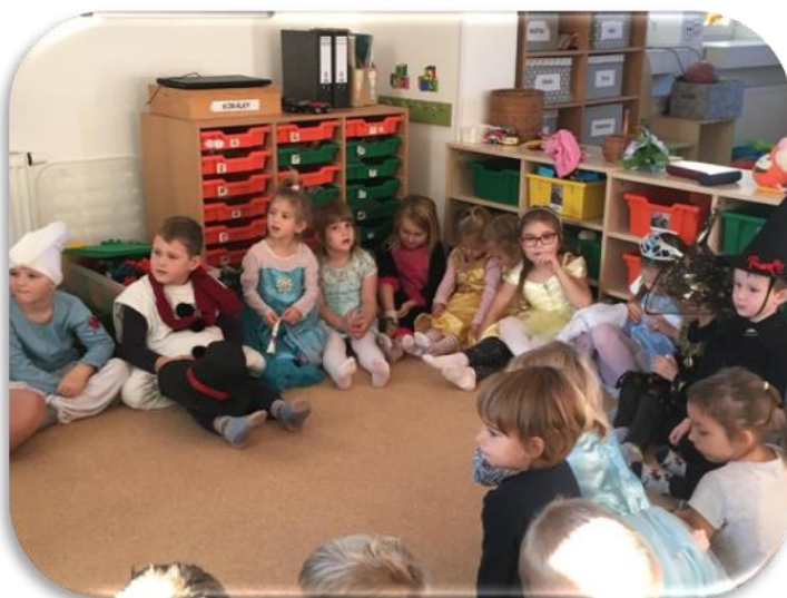
(PROJEKTOVÝ DEN V MŠ - CESTA DO POHÁDKY)