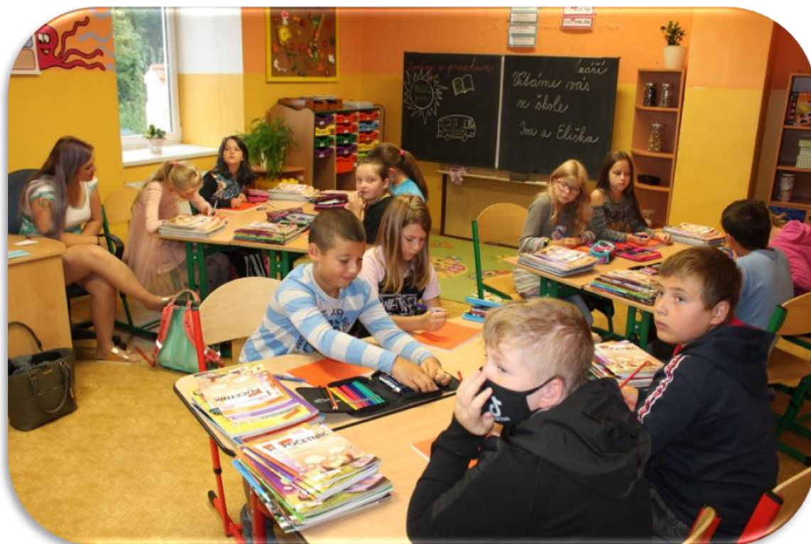
(PRVNÍ DNY VE ŠKOLNÍM ROCE 2020/2021 - „ČTVRŤÁCI“)