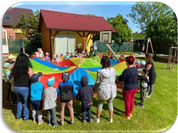
(VESMÍRNÝ DEN DĚTÍ V MŠ)