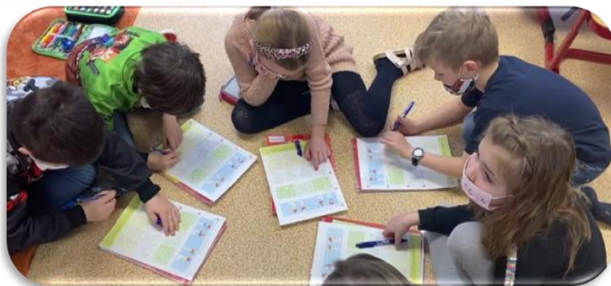
(VÝUKA HEJNÉHO MATEMATIKY U PRVNÁČKU A DRUHÁČKŮ)