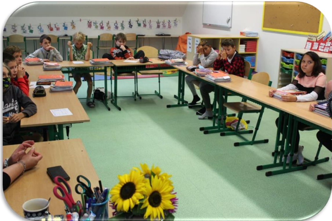
(PRVNÍ DNY VE ŠKOLNÍM ROCE 2020/2021 - „PÁŤÁCI“)