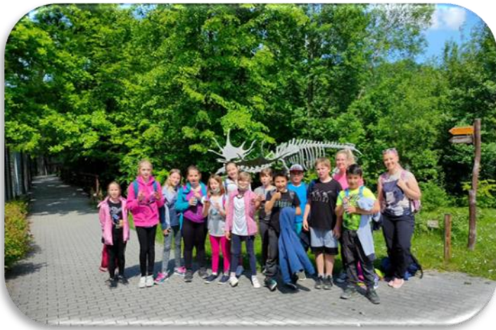
(DEN DĚTÍ ČTVRŤÁKŮ V ZOO HLUBOKÁ NAD VLTAVOU)