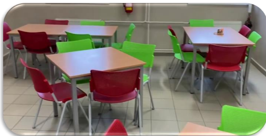
(NOVÁ JÍDELNA V ZŠ)