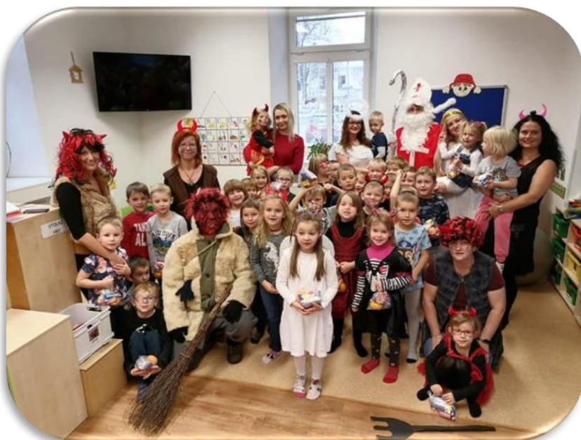
(MIKULÁŠSKÁ NADÍLKA V MŠ)