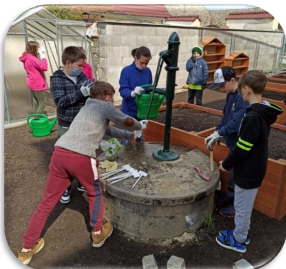
(PÉČE O NOVOU ŠKOLNÍ PŘÍRODNÍ ZAHRADU)