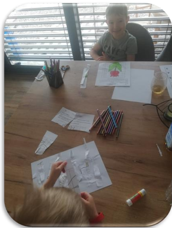
(DISTANČNÍ VÝUKA V MŠ)