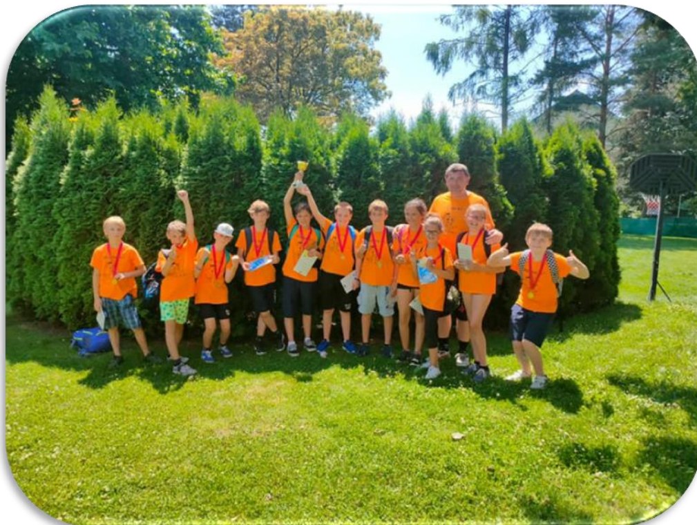
(VÝHRA PÁTÁKŮ V SOUTĚŽI BIATLON TROCHU JINAK)