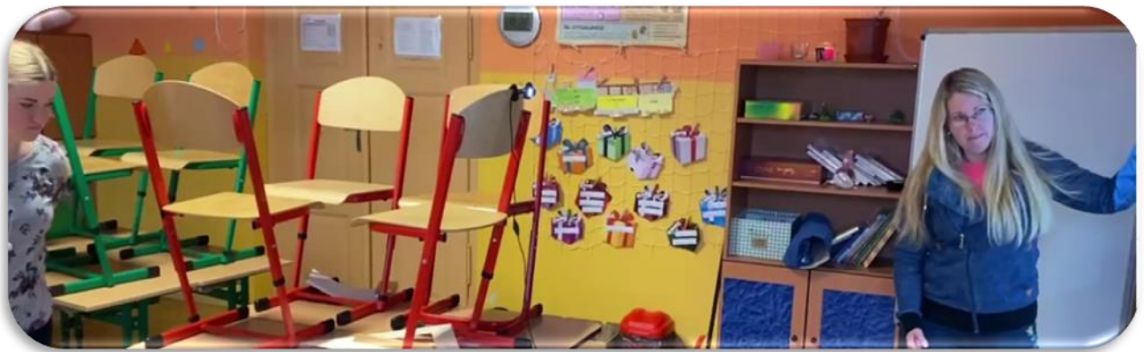
(DISTANČNÍ VÝUKA V ZŠ)