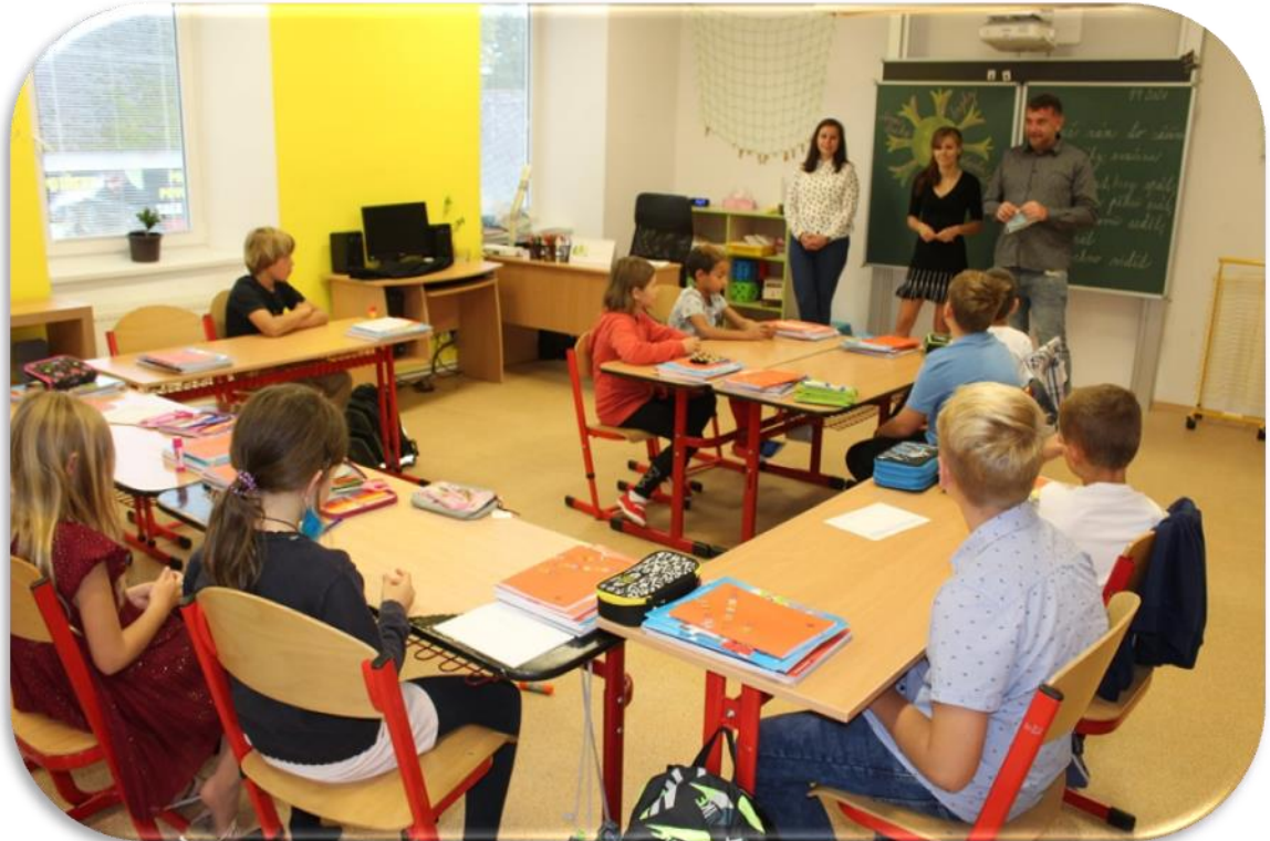
(PRVNÍ DNY VE ŠKOLNÍM ROCE 2020/2021 - „TŘEŽÁCI“)