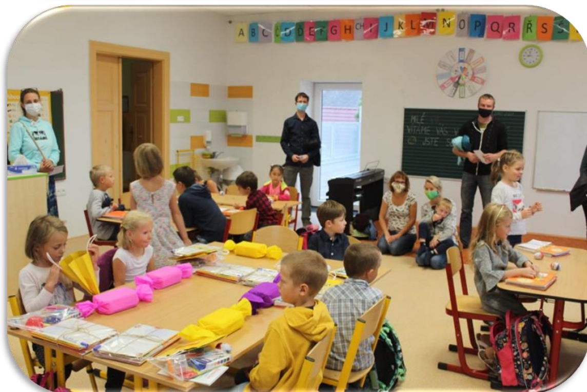
(PRVNÍ DNY VE ŠKOLNÍM ROCE 2020/2021 - „PRVŇÁCI A DRUHÁCI“)