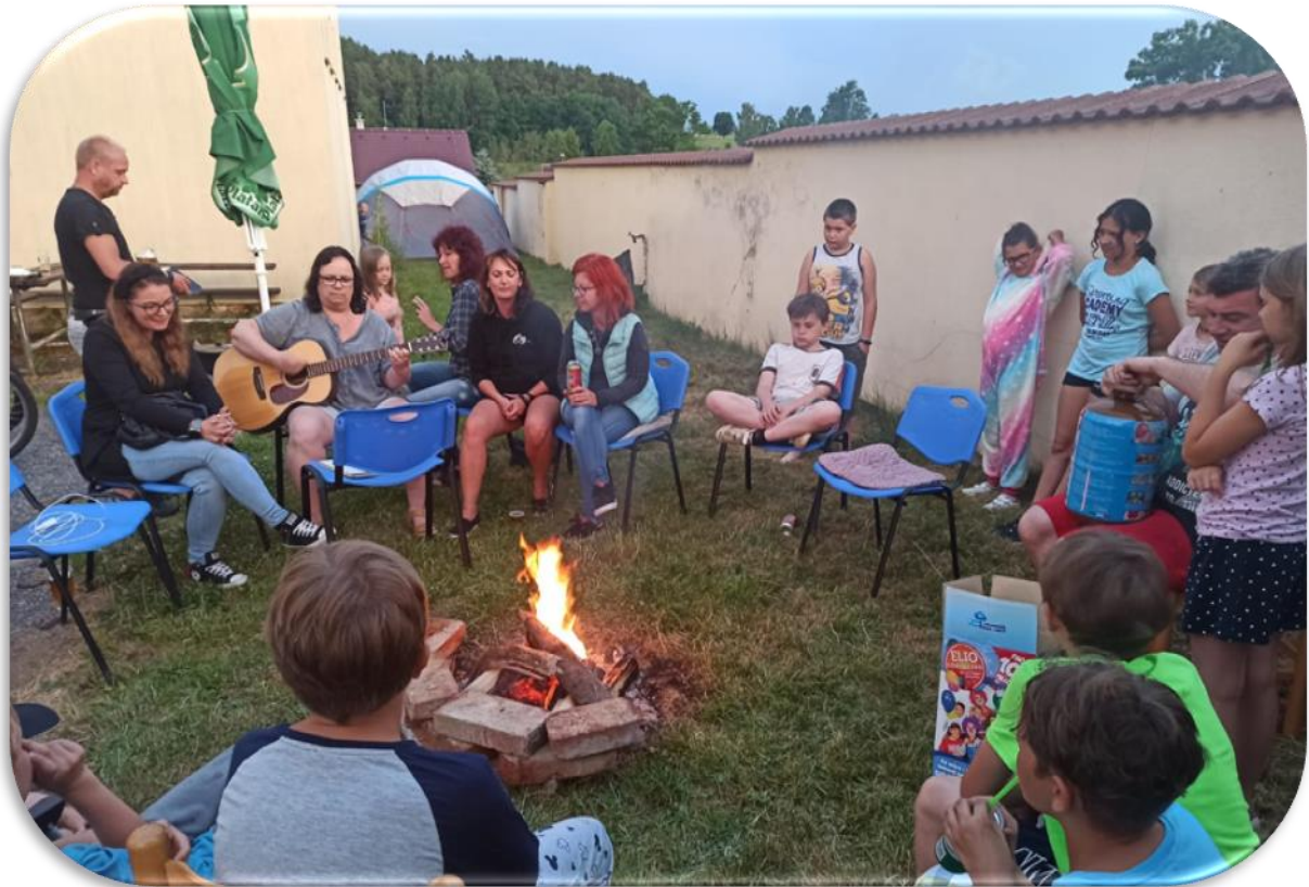
(CYKLOVÝLET A ROZLOUČENÍ S PÁŤÁKY)