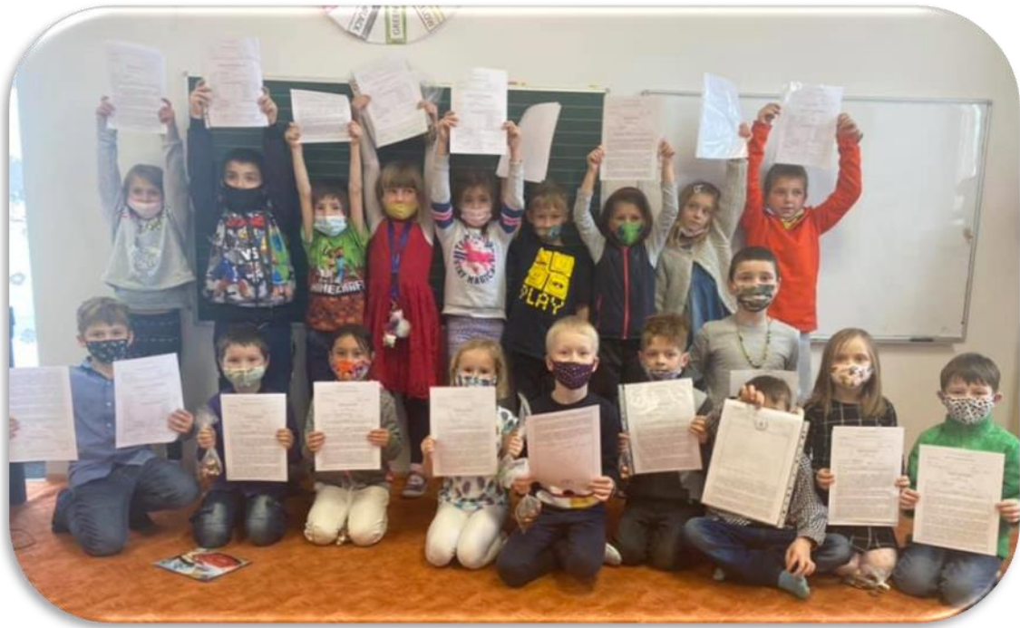
(POLOLETNÍ VYSVĚDČENÍ - PRVNÍ VYSVĚDČENÍ NAŠICH PRVNÁČKŮ)