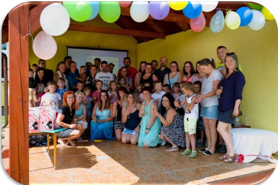
(ROZLOUČENÍ S PŘEDŠKOLÁKY)